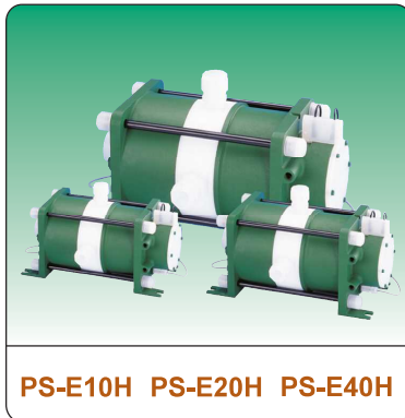
PS-E10H PS-E20H PS-E40H