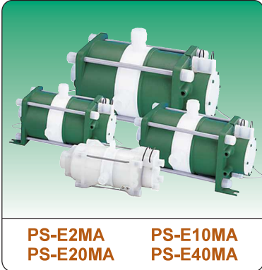
PS-E2MA PS-E10MA PS-E20MA PS-E40MA