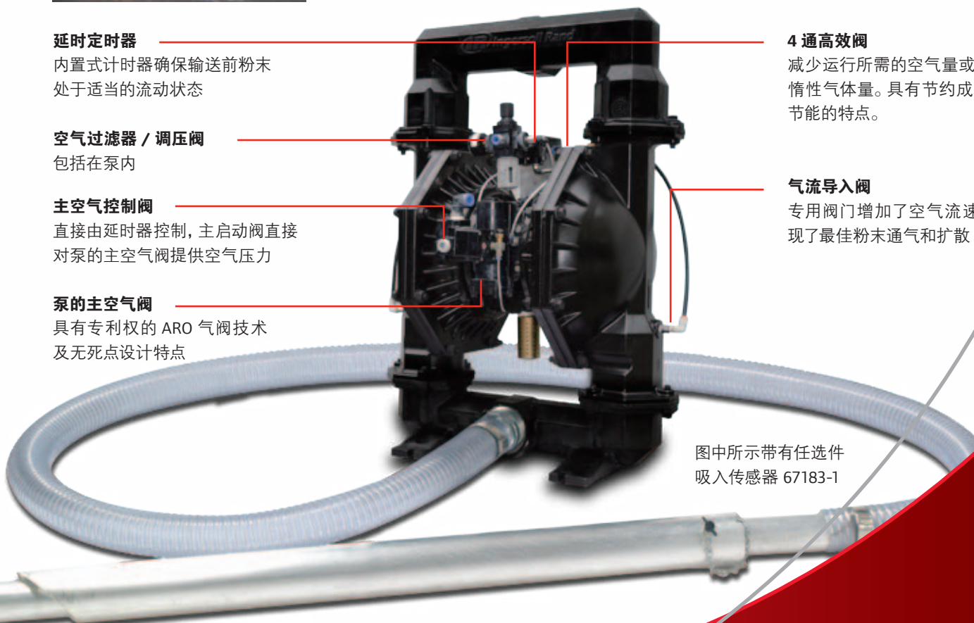
图中所示带有任选项吸入传感器 67183-1